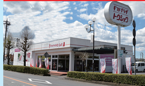
常総市新石下4533 ○営業時間:10時~18時【水曜定休】