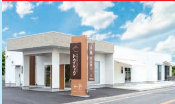
常総市原宿905-3 ○24時間対応【年中無休】