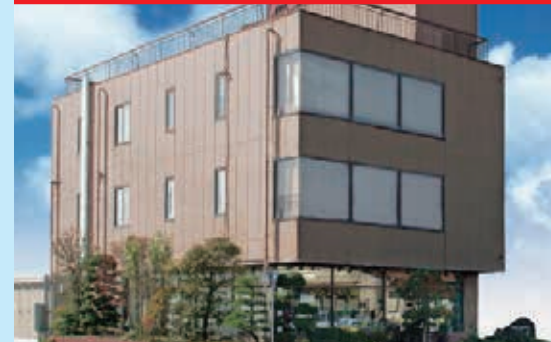
常総市新石下3536 ○営業時間:9時~18時【年中無休】

「ヘキサホール・きぬ」や 「つくばメモリアルホール」など 公営斎場でのご葬儀も おまかせください